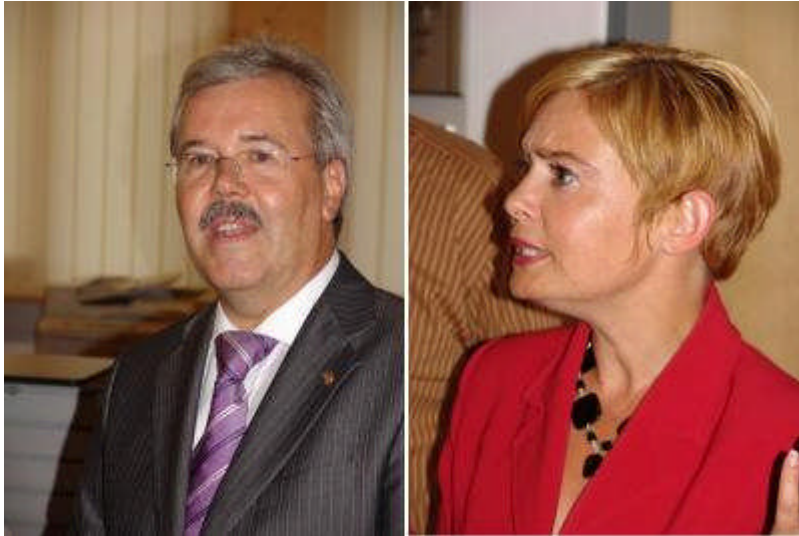
Kunst & Kommerz können sich wunderbar ergänzen

Artikel von Wilfried Buchacher erstellt am 05.08.2006