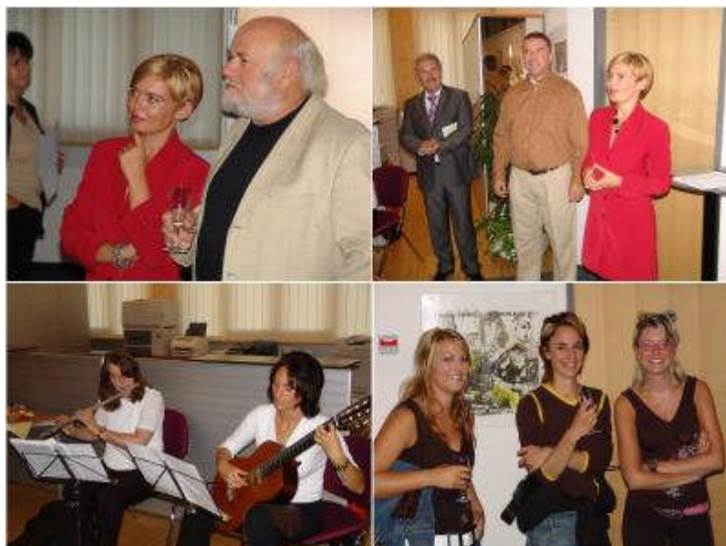
Künstlerkollegen unter sich, musikalische Umrahmung und auch den jüngeren Besuchern schien es zu gefallen