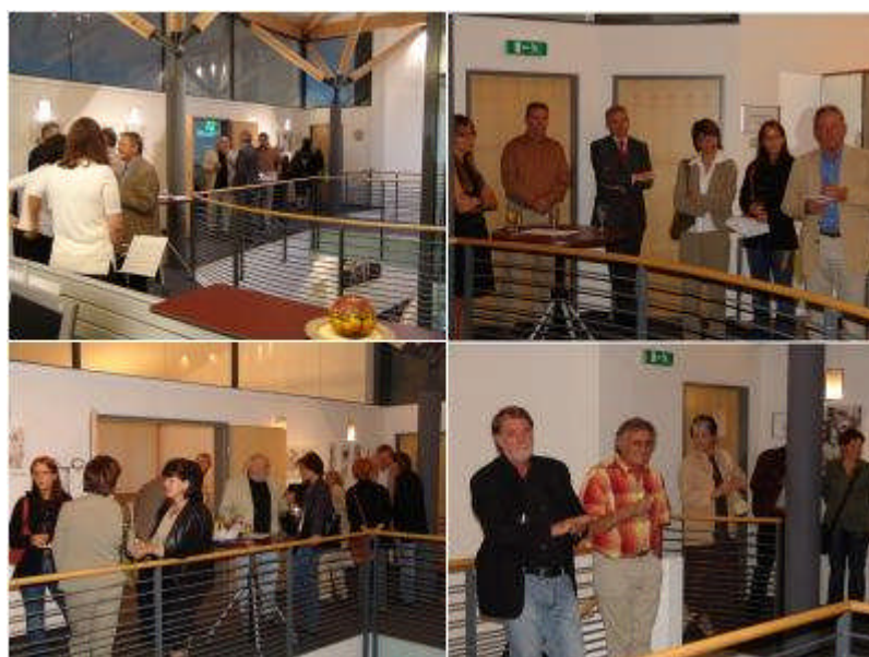
Die Räumlichkeiten der Volksbank eignen sich bestens für diese Art von Veranstaltungen