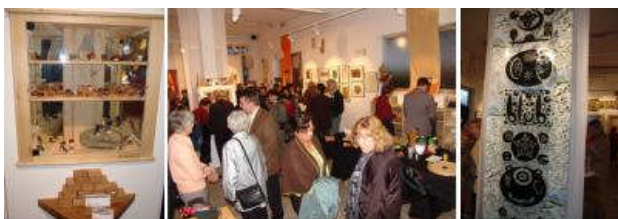
Volles Haus und das an einem Karfreitag, Gratulation!