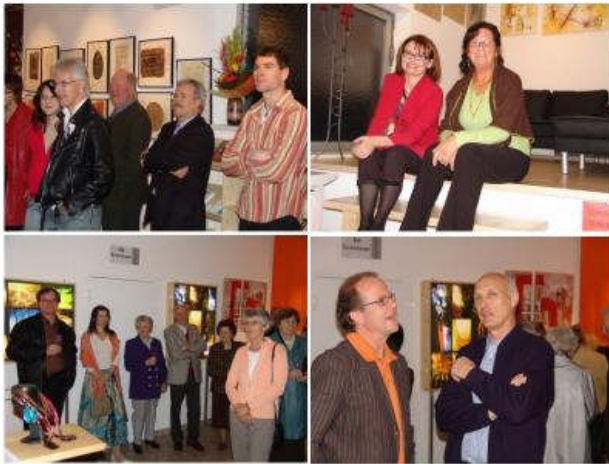
Zahlreicher Besuch von Wirtschaft & Öffentlichkeit an diesem Freitag in Hermagor ...

Artikel von Wilfried Buchacher erstellt am 15.04.2006