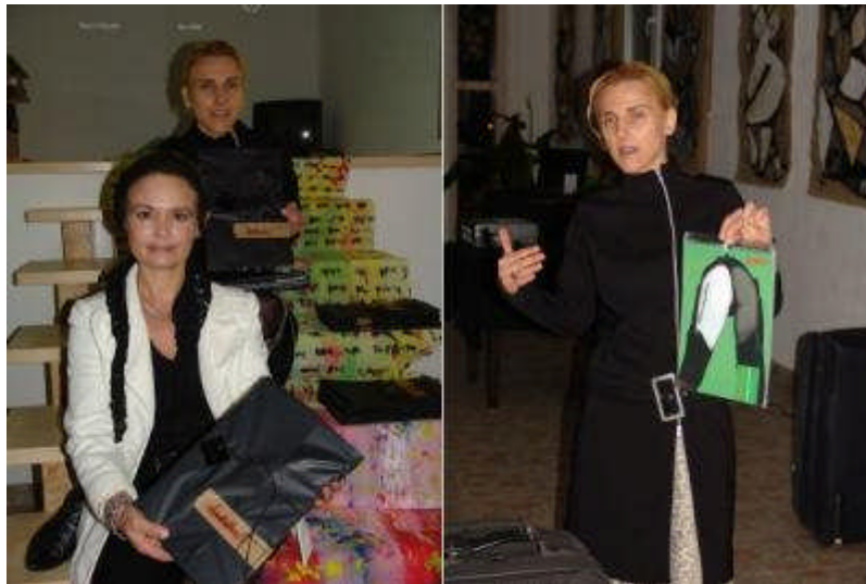
Die Kunstaktien mit schwarzer Verpackung verbergen viele Geheimnisse, nur soviel - der Kalender gehört auch dazu ...